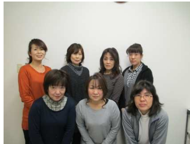
(ケアマネージャー)

利用者から選択される事業所を目指し、新規利用者の確保に努める。また専門職として資質向上を念頭に置いた各種研修会の参加を積極的に行い、職員の技量を高める。