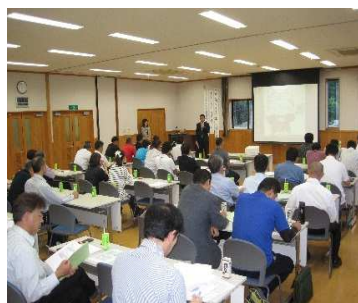
(紀北地域協議会相談部会)

各部会活動のほかに平成19年度から取り組んでいる「避難訓練」は福祉避難所運営なども含め継続して行う。また圏域研修についても継続し、紀北地域の支援者のスキルアップや地域づくりに努める。