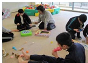
（日中一時支援事業）

夏休み等の長期休暇において、家庭外での居場所が必要な障がい児に対して日中一時支援サービスを提供する。