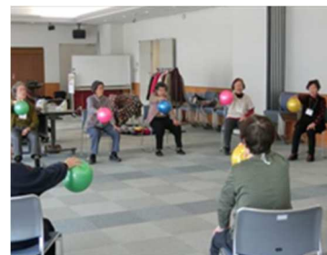
(ほのぼのサロンでの体操)