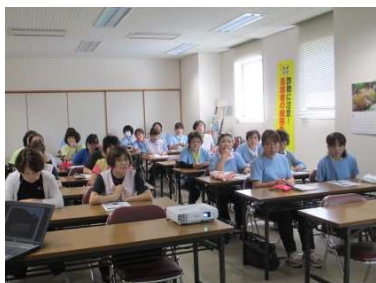
(感染症についての研修会)