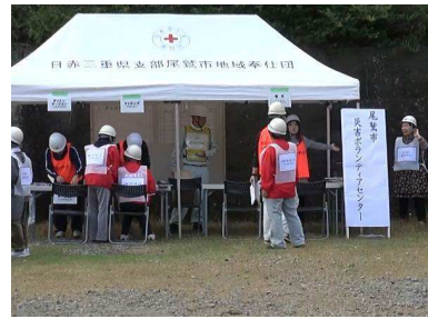
(災害ボランティアセンター訓練)

前年度に引き続き、市民との協働型の災害ボランティアセンター運営を目指し、災害ボランティアコーディネーターを養成する。