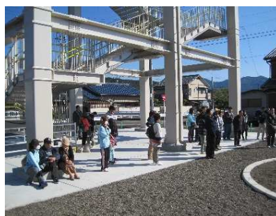
(紀伊長島避難訓練)