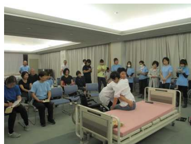
(PTによる介護実技指導)

(3) 利用者・家族のニーズを尊重した介護サービス計画書の作成と、質の高いサービスの提供を行う。