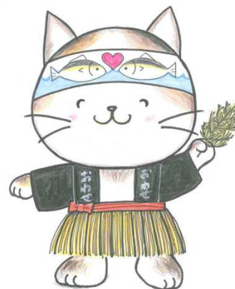
尾鷲よいところ「ヤーヤにゃん」