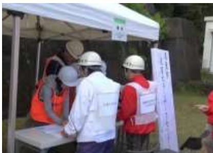
設置運営訓練（早田町）