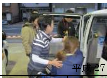
平成 27 年度 避難訓練