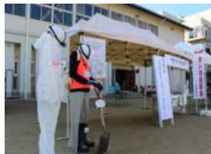
尾鷲市防災フェア