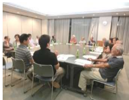
（ 結成総会 ）