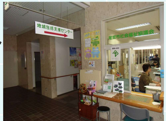
尾鷲市福祉保健センター1階にあります。 受付にてお声かけください。